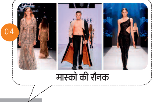
मास्को की रौनक